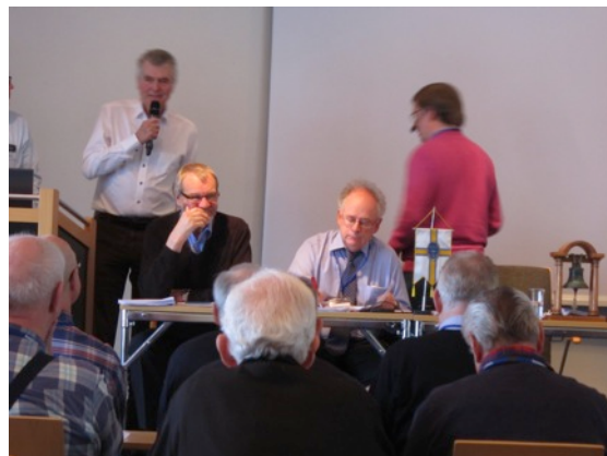
Från mötesförhandlingarna. Här redovisar utskottet en motion man behandlat.

Mötet inleddes med att stadens borgmästare bjöd in alla deltagare till välkomstmöte i stadshuset där han bl.a. berättade om stadens historia. Efter välkomstmötet så fick deltagarna en guidad busstur genom staden och ut till stadsdelen Råå där vi besökte småbåtshamnen och konstatera att många båtar redan var sjösatta, eller att de låg i året om. Man fick känslan av att båtsäsongen hade varit i gång länge eftersom det var nästast fullt med båtar vid bryggorna. Den guidade bussturen avslutade med ett besök på slottet Sofiero där det även bjöds på lunch.