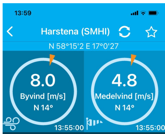
Realtidsinformation från väderstationen på Harstena den 21 april 2024

även se gällande vattentemperatur och vattenstånd.