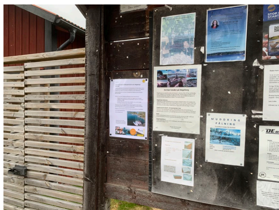
Båtklubbens informationsblad är även uppsatt på anslagstavlor i Stegeborg och i Arkösund.

Informationsbladet som "klistrades" på båtarna i Stegeborg, informerade om klubbens verksamhet och vilka fördelar som finns att just vara med i Stegeborgs båtklubb.