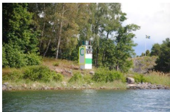
Fyren Fårholmen när man testar märkningen med bokstaven C.

Det var då många båtägare i Stegeborg båtklubb som då oroade sig för att Sjöfartsverket väljer att släcka ned ledfyrarna för gott. Man tänkte då att de flesta fritidsbåtar hade en GPS-plotter i sin båt och kunde navigera med hjälp av GPS-plotter.