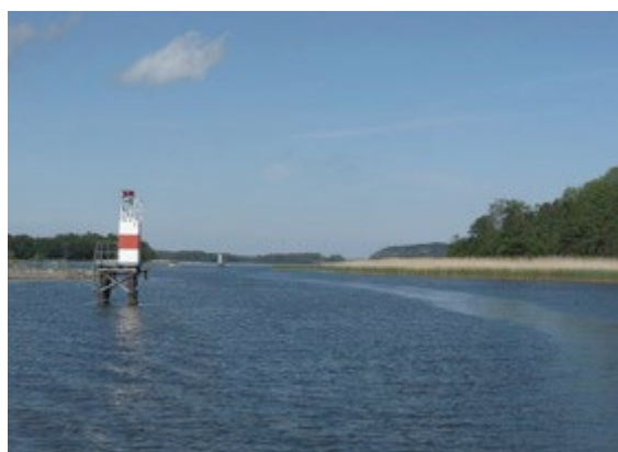
Fyrarna i Ettersundet. Fyrarna har varit en trygghet för oss som har båten i Stegeborg att navigera efter på natten.

Nu har dock tiderna förändras, med tanke på konflikterna i vår omvärld. Vi märker redan av att man har stört ut störningar på det Global Navigation Satellite System (GNSS). Därför känns skönt att man inte släckte ned våra fyrar, utan att de finns kvar. Visst är det en trygghet och säkerhet att se en fyr på natten som man kan navigera efter samt även lokalisera sig med.