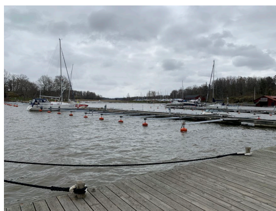
Stegeborg den 21 april och det är få båtar i hamnen.