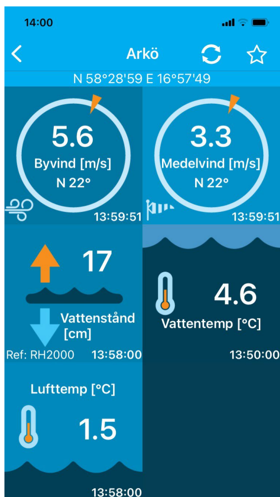
Realtidsinformation från väderstationen i Arkösund den 21 april 2024. Förutom vindriktning och vindstyrka kan man

Man kan få information om väderförhållanden i realtid, genom att även gå in på Sjöfartsverkets hemsida, och sedan välja "ViVa- Vind- och vattenstånds-information" se länk