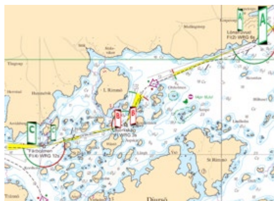
Sjökortsbild där provet skulle genomföras, på sjökortet kunde man se hur tavlorna skulle se ut som då skulle vara monterade på fyra i farleden.

För ca tio år sedan genomförde Sjöfartsverket ett projekt för att prova ut en ny utmärkningsmetod i vår farled utanför Stegeborgs båthamn. Det var frågan om farleden som leder från Arkösund till Mem. Bakgrunden till projektet var att Sjöfartsverket skulle minska underhållskostnaderna för farleder som har lägre klass och samtidigt behållen sjösäkerhet.