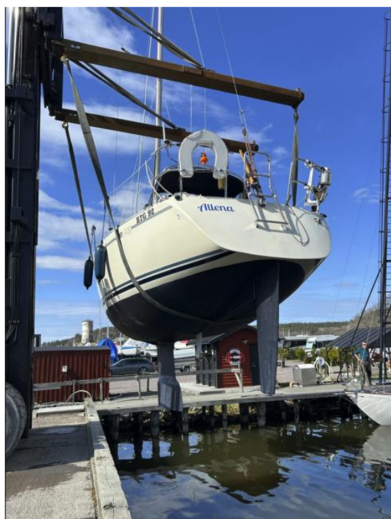
Sjösättning av Maxibåten Allena den 17 april.

ska strula – att motorn inte vill starta eller att det har uppstått något läckage under vintern. I år var oron extra påtaglig, då vi även hade bytt en genomföring och därför var särskilt uppmärksamma på att allt skulle fungera som det skulle.