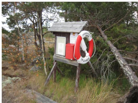
Den gamla anslagstavlan som båtklubben satte upp när vi fick tillgång till ön.

Sedan 1991 har båtklubben haft förmånen att nyttja Lindskär som klubbholme. Det innebär också att klubbholmen i år firar 35 år.