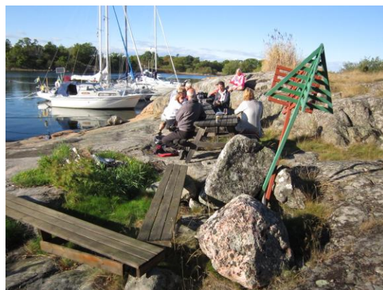
Lindskär sommaren 2016.

Där bryggan finns i dag kunde man tidigare endast förtöja ett par båtar, eftersom berget är mycket brant. Det fanns därför i princip bara ett litet utrymme där det var möjligt att ta sig upp på berget.