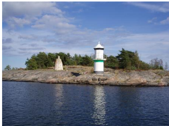
Torrö Stickskär Tjust skärgård. På bilden ser man ett relativt modernt sjömärke i form av ledfynd och en kummel.

lågmäld och ålderstigen. Spårö båk som är vit hög och välkänd.