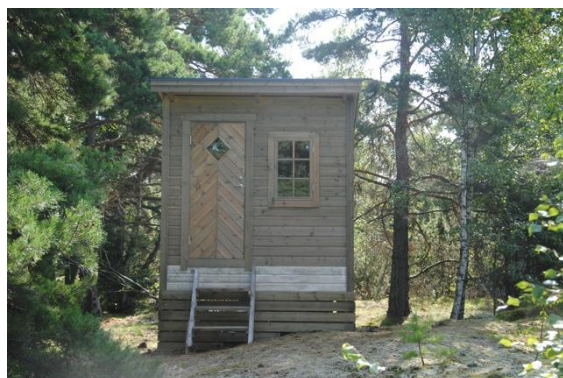
Toaletten på Lindskär står klar 2011.

LOVA-bidrag (Lokala vattenvårdsprojekt) är ett statligt bidrag som kan sökas av föreningar för åtgärder som förbättrar miljön i sjöar och kustvatten. Bidraget används ofta till projekt som minskar övergödning, förbättrar sanitära lösningar eller på andra sätt skyddar vattenmiljön.