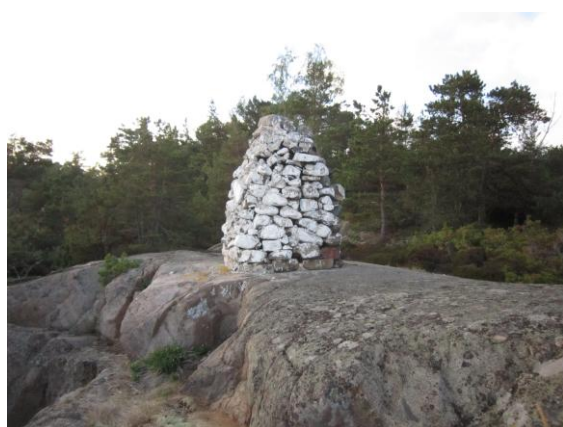
En kummel i sten som ligger på ön Ekholmne i närheten av Häradsöskär. Dock finns den inte med i sjökortet.

Visste ni att båkar och kumlar är några av de äldsta hjälpmedlen för sjöfarten längs kuster och farleder. Redan under forntiden använde sjöfarare enkla landmärken för att orientera sig från sjösidan. Dessa märken placerades ofta på höjder eller uddar där de syntes tydligt från havet.