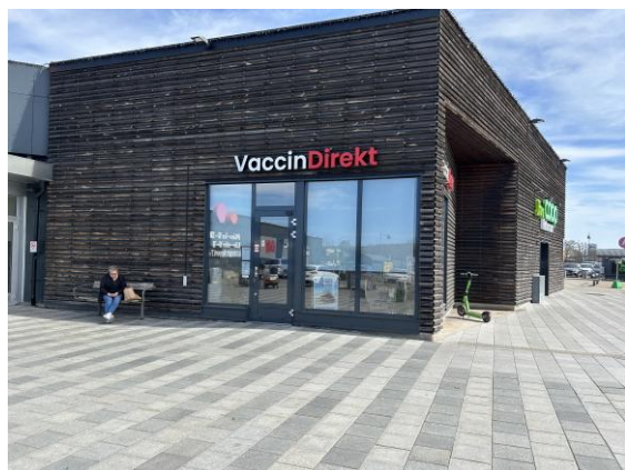
Vaccinationsmottagning vid Ingelsta Shopping i Norrköping.

Fästingar är vanligt förekommande, framför allt i strandnära och vegetationsrika miljöer. Området innebär en risk för borrelia samt lokalt även för TBE, varför förebyggande åtgärder och vaccination vid regelbunden vistelse rekommenderas.