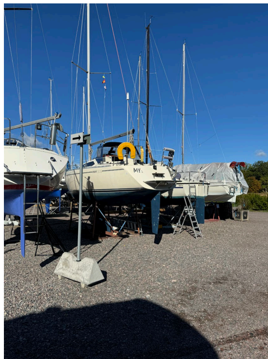
Båtuppläggnen i Stegeborg hösten 2024.

Förutom det måste botten tvättas och sedan bör båten även täckas.