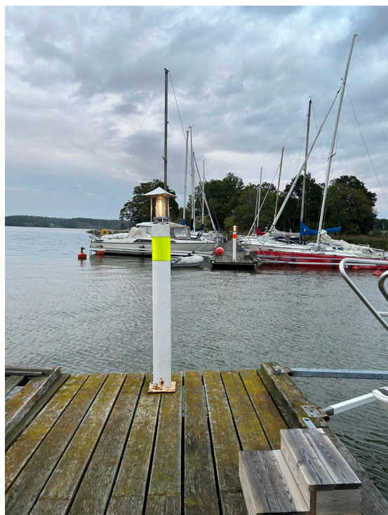
På bilden kan man se att rost har smugit sig på fyren som har fast ljus.

Fyrarna som finns i Stegeborgs småbåtshamn ägs formellt av Stegeborgs egendom och monterades på bryggorna 2004 av båtklubbens medlemmar. Stegeborgs Båtklubb sköter dock underhållet för de båda fyrarna.