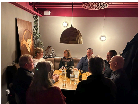
Det var go stämning runt bordet och många sjörövarhistorier hanns med.

Det var många "Stegeborgare" som valde att vara med vid båtklubbens höstträffa "Kallsupen" som anordnades fredagen den 22 november. Vi träffas för att äta en god bit mat och ta en öl. Träffen skedde vid Pigeon Street som ligger i Knäppingsborg i Norrköping.