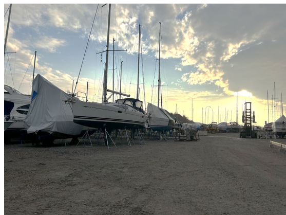
Båtuppläggningsplatsen i Stegeborg lite tidigare i höstas. Första sjösättning i Stegeborg sker den 11 april.