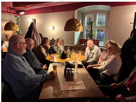
Många "Stegeborgare" som samlats för att är en bit mat.

Det var många som tyckte att initiativet var mycket trevligt och att det var go stämning runt bordet. Några av deltagarna uppgav också att de åt en av de bästa pastarätter de någonsin ätit vilket inte gjorde inte saken sämre.