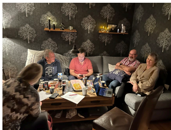
Styrelsen samlad för styrelsemöte nummer 4 i år.

Under året har båtklubben haft 4 styrelsemöten. Den 28 november var det sista för i år och då bestämde vid vilka aktiviteter vi ska ha under 2025. Vidare diskuterades vilka inventeringar samt underhållsåtgärder som måste göras på vår klubbholme förutom städning och inlojning av brygga, bänkar och bord. På styrelsemöten går vi igenom ekonomin och vår sekreterare upprättar ett mötesprotokoll på vad som hanteras på mötet.